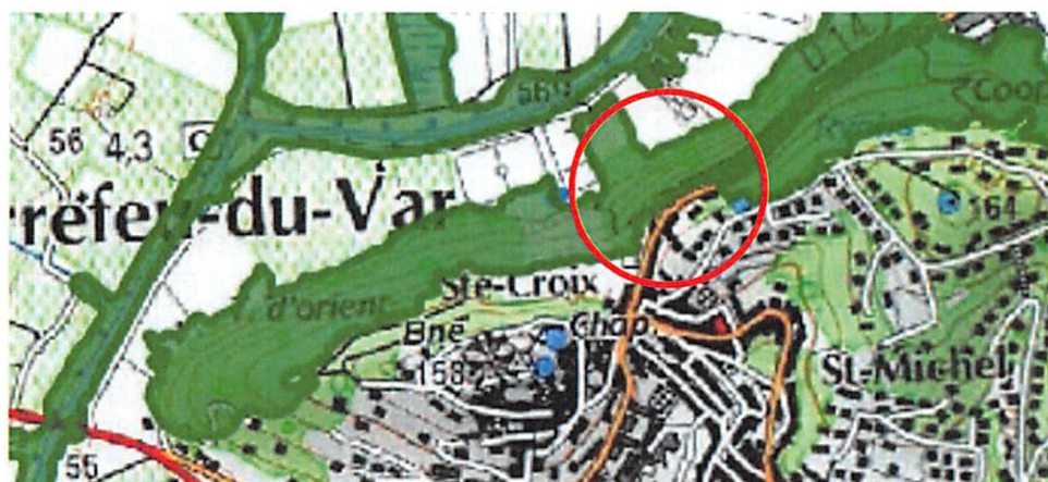
Cartographie soumise au défrichement