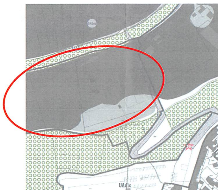
Extrait PLU approuvé en date du 04/02/2020