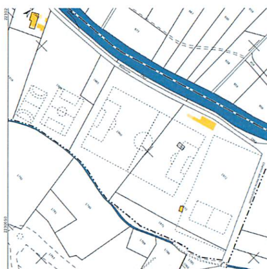
Plan cadastral des parcelles